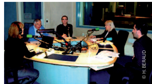
Les journalistes de l'Actualité francophone dans un des studios de Radio France.