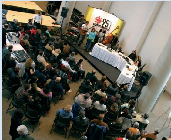
En direct et en public, le jour de l'ouverture de la Grande Bibliothèque, la Première Chaîne de Radio-Canada a présenté deux émissions spéciales.