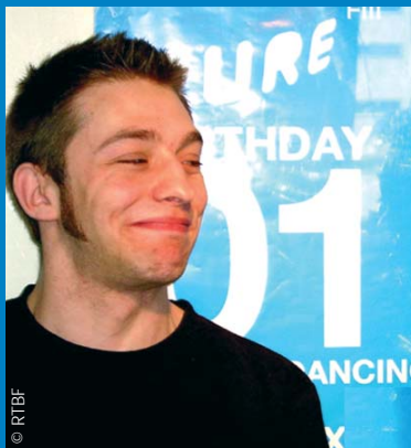
Raphaël Charlier, comédien devenu animateur, est aux commandes de RC4 , chaque soir de 20 heures à 23 heures.