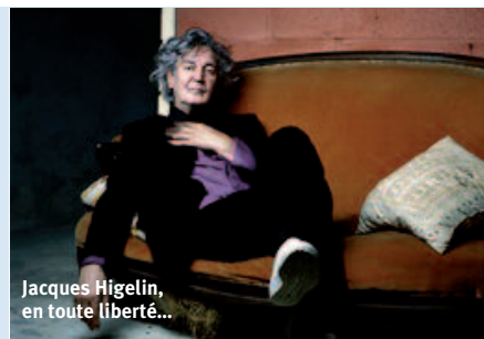
Jacques Higelin, en toute liberté...