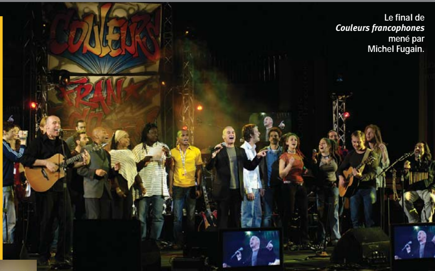
Le final de Couleurs francophones mené par Michel Fugain.