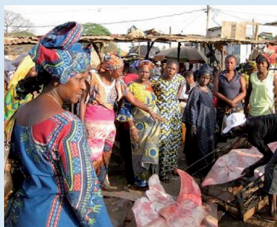
Jour de marché à Conakry, capitale de la République de Guinée.