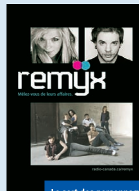
Le sort des personnages de la web série RemYx dépend du choix du public...

Le record de "visionnement" sur Internet n'appartient pas à une série télé mais plutôt à une web