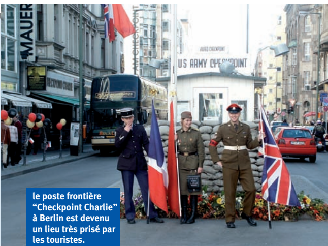
Le poste frontière "Checkpoint Charlie" à Berlin est devenu un lieu très prisé par les touristes.